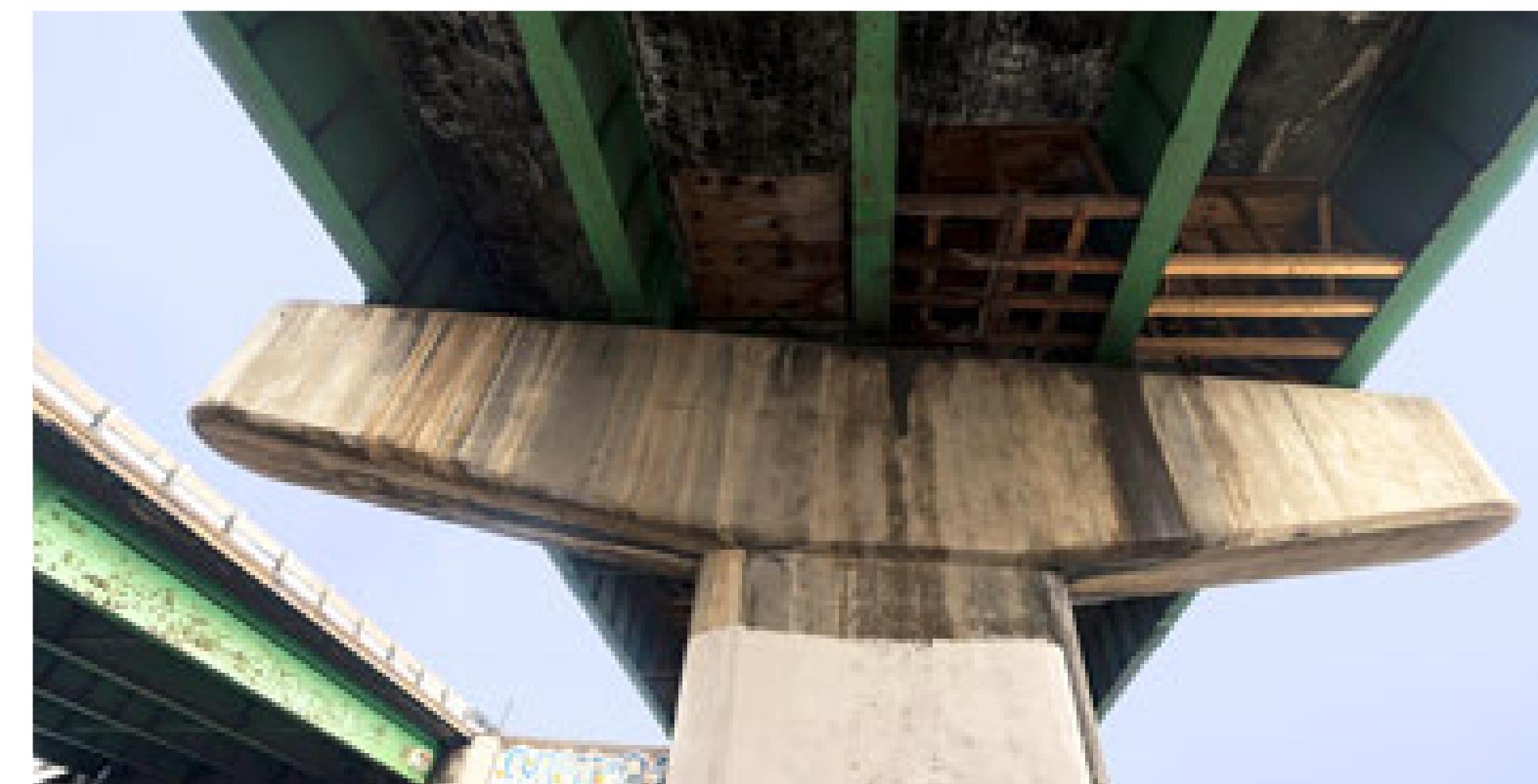
Deteriorating bridge conditions on I-270 over Brighton Boulevard Deterioro de las condiciones del puente en la I-270 sobre Brighton Boulevard