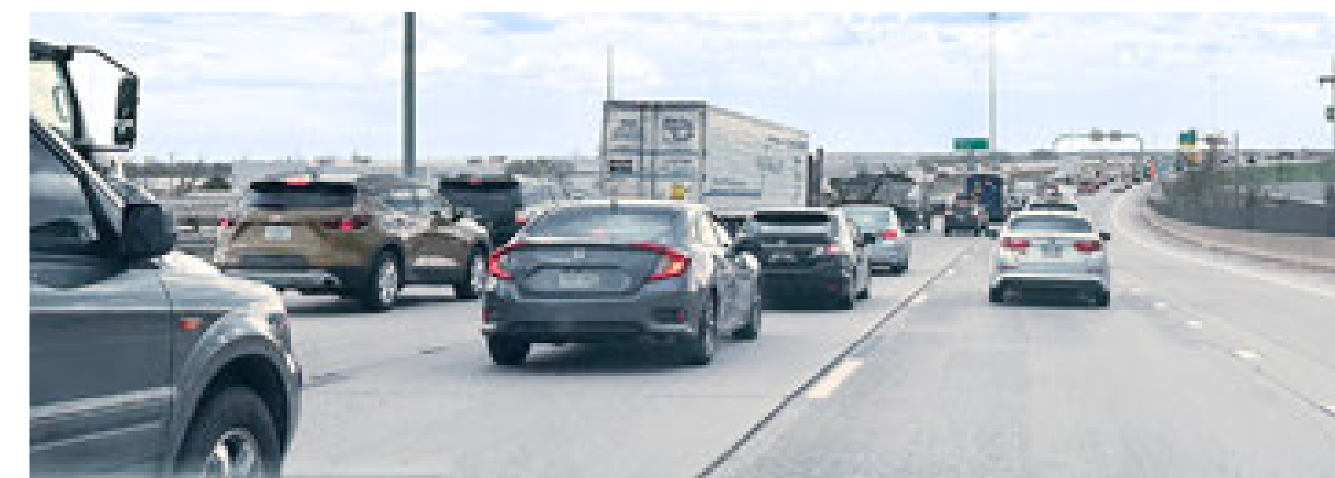
Mid-day congestion on I-270 Congestión al mediodía en la I-270