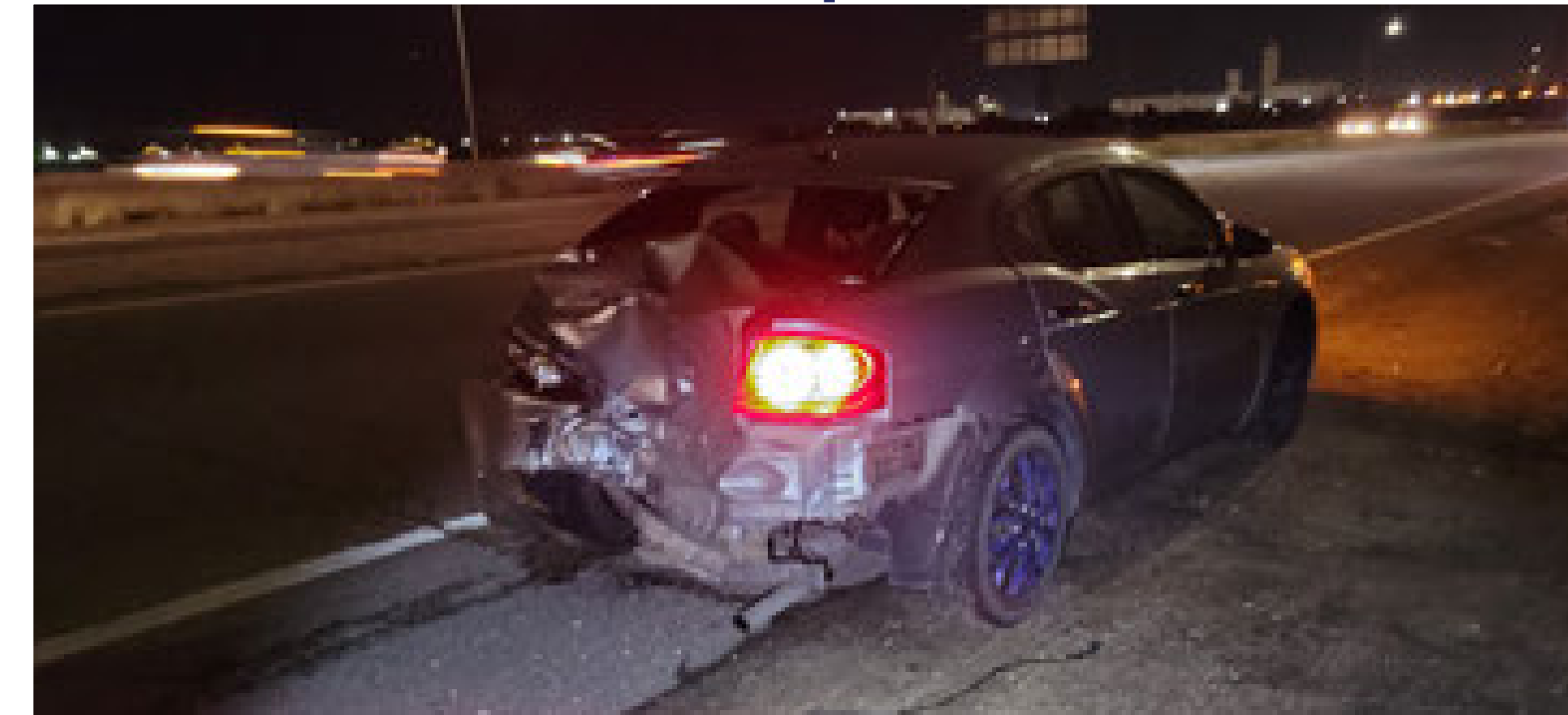
Crash on I-270 Choque en la I-270

Minimize environmental and community impacts resulting from the project