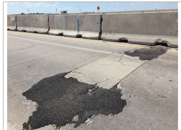
La unión hacia el este del puente de la I-70 necesita reparaciones

Si tiene dudas o inquietudes, llame a la línea de información del proyecto al 719-340-0380 o envíe un correo electrónico al: pr@workzone.info . Para suscribirse para recibir alertas, visite la página web del proyecto: www.codot.gov/projects/i70burlingtoneast .