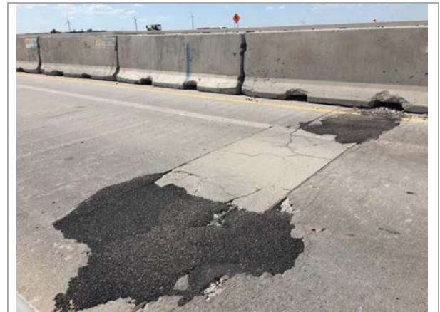
Eastbound I-70 bridge joint in need of repair

Rehabilitation work involves replacing concrete approach slabs and guardrail, performing deck repairs, and repairing slope and ditch paving on I-70 bridges over county roads. These bridges were built in 1969 and the last major work on these structures took place more than 20 years ago. The approximate cost of the project is $3.5 million.