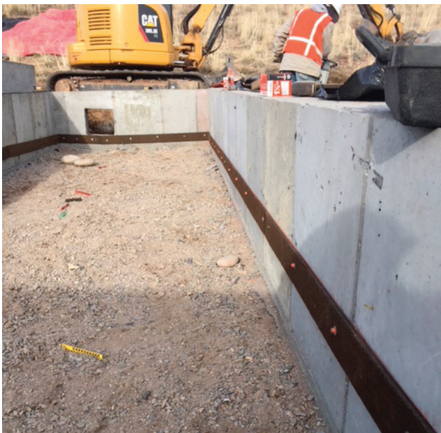
30' x 19' foundation for deer guard Cimiento de 30' x 19' para la guarda de venados

Si tiene alguna pregunta sobre el proyecto, comuníquese con el equipo de información pública por teléfono. Si desea enviar sus preguntas por correo electrónico, recibirá una respuesta dentro de las 24 horas hábiles.