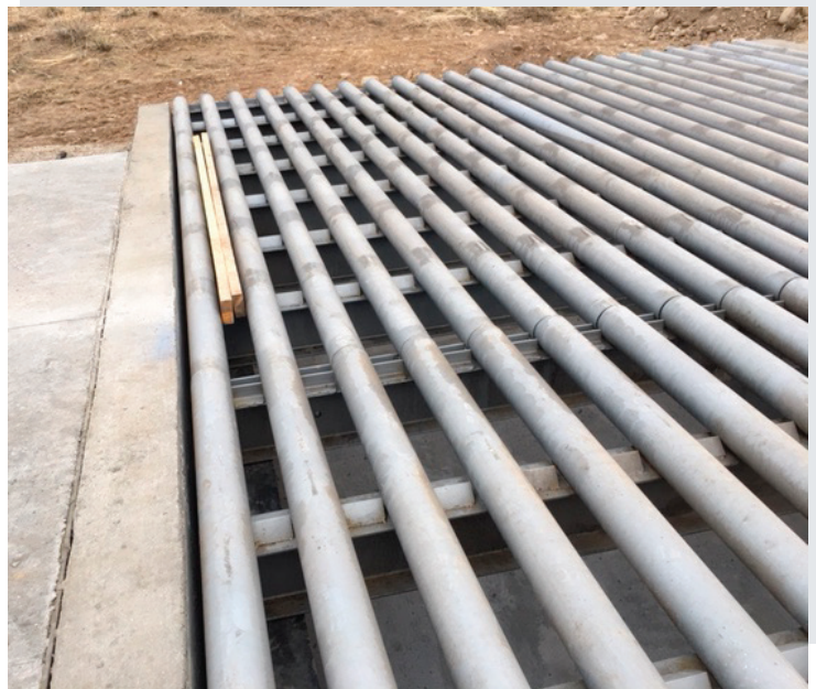
7,000 lbs. grate on top of deer guard to keep wildlife off the highway 7,000 lbs. de rejilla en la parte superior de la guarda de venados para mantener la fauna silvestre fuera de la carretera