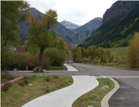
지역 5 지방 기관을 위한 텔루라이드 사이드워크 수송 개선

“이 정책 공표의 목적은 전체적으로 볼 때 공공의 편익을 위해 설계된 프로그램으로 인해 이주민이 심각한 피해를 입는 일이 없도록 연방 프로그램 및 연방 지원 프로그램에 따라 이주하는 사람을 공정하고 평등하게 대우하기 위해 일관된 정책을 수립하기 위한 것입니다.”